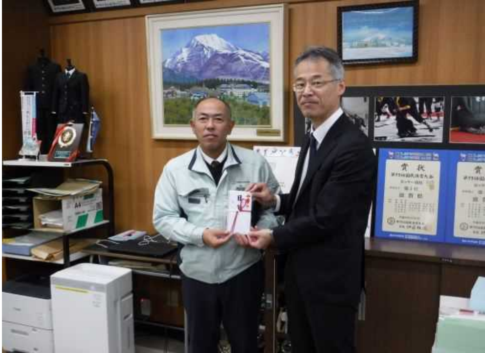
贈呈式の様子（校長室にて）

この度、上田興産株式会社様から地域貢献事業の一環として、カラーベンチ 2 台を寄付していただきました。 (2024. 11. 21)